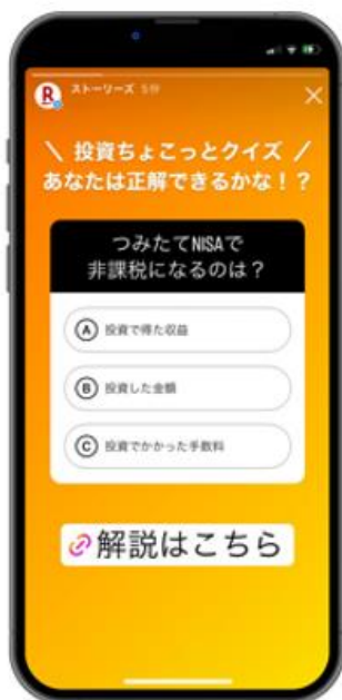
「クイズ」機能で 参加して学びにつながる