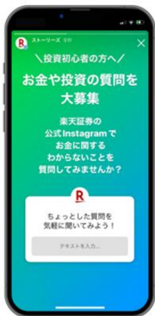
「質問」機能で お金や投資の悩みを募集