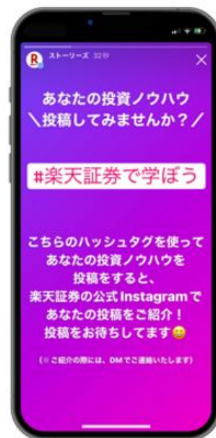
「#楽天証券で学ぼう」投稿で 体験談の共有も!