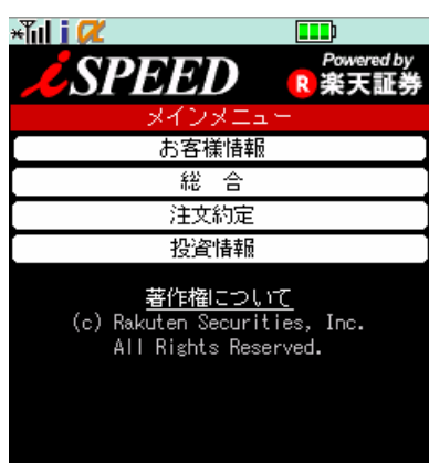
メインメニュー画面