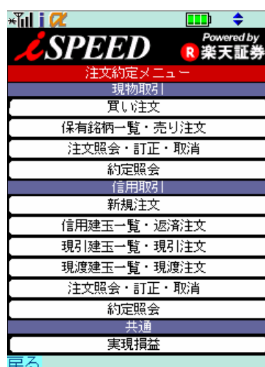
注文約定メニュー